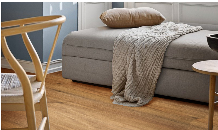
Pavimento vinílico SPC Carvalho Urze