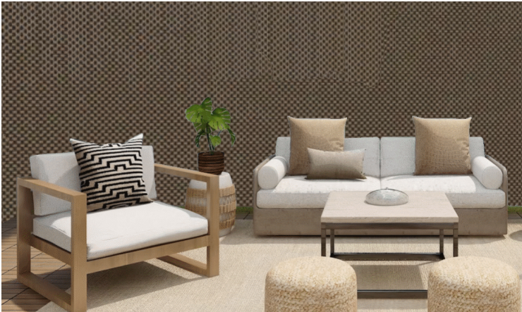
Tela de Ocultação Castanha